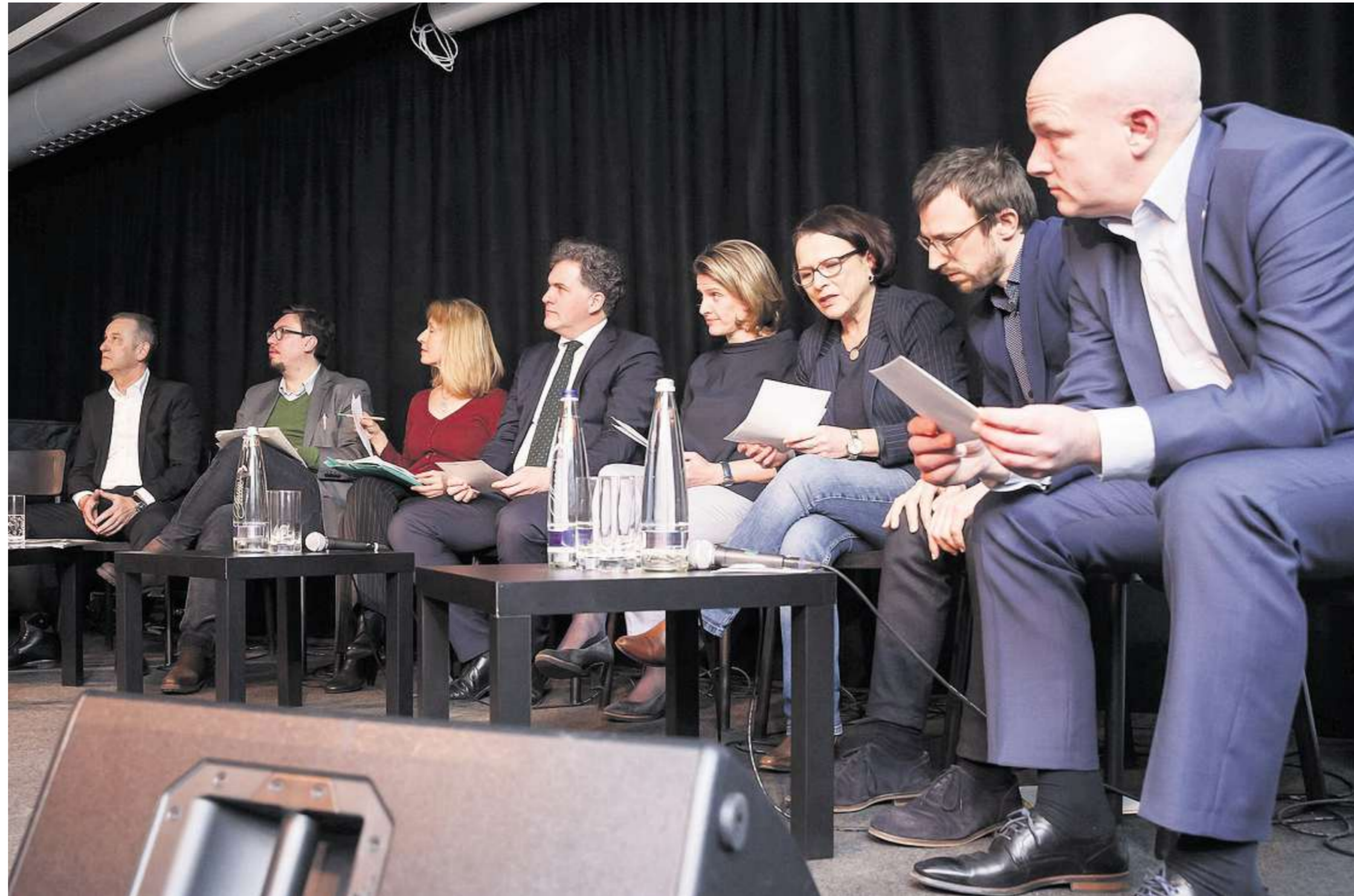
Die Mittelbayerische hat die Stimmung in der Regensburger Wahlbevölkerung zu Kandidaten und Parteien abgefragt.